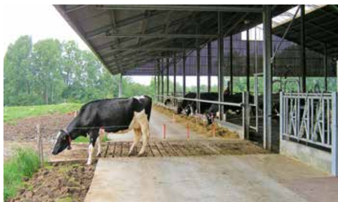
De koeien kunnen er geheel vrijwillig voor kiezen te weiden.

Om de hedendaagse hoge melkproducties te kunnen bereiken en te handhaven, moet hoogproductief melkvee grote hoeveelheden energie opnemen. Om aan deze hoge energiebehoefte te voldoen worden aan het rantsoen via krachtvoer veel snel afbreekbare koolhydraten toegevoegd. Dat brengt echter met zich mee dat er vaak te weinig structuur is. Zoals onderzoek inmiddels bij herhaling duidelijk heeft gemaakt, is dat de basis voor pensverzuring. En van koeien met pensverzuring weten we inmiddels dat ze ondermaats presteren. Dat kost de melkveehouder structureel geld. "Natriumbicarbonaat zorgt van nature voor buffering in de pens, een buffer die koeien bij het herkauwen zelf produceren", zegt ir. Ludo Segers van Orffa. "Bij elk rantsoen voor hoogproductief melkvee schiet de eigen productie van natriumbicarbonaat tekort. Daardoor dreigt continu pensverzuring." De voederadditievenspecialist voert aan dat inmenging van 250 gram Bicar Z (natriumbicarbonaat van Solvay) per koe per dag in het rantsoen pensverzuring helpt te voorkomen. "Daarmee wint men overigens niet alleen op de productie, maar ook op algemene gezondheid en langleeftbaarheid", aldus nog Ludo Segers.