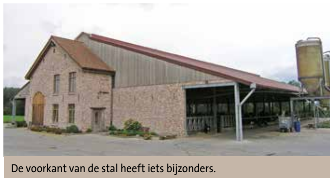
De voorkant van de stal heeft iets bijzonders.

Gedurende drie melkcontroles kregen de dieren 250 gram Bicar Z per koe, per dag in het rantsoen (via de mengvoederwagen). De proef toonde aan dat de melkproductie wezenlijk stijgt (versta, met een statistisch significant verschil), zie figuur. Het effect op de melk was bovendien duidelijk groter bij hogere supplementatie. Verder steeg ook het melkvet, maar was er in de proef geen effect op de herkauwactiviteit. Het effect op de mestkwaliteit ten slotte was in deze proef niet eenduidig en verdient verder onderzoek. Een vervolgprouf heeft inmiddels aangetoond dat het opnieuw verlagen van de dagelijkse dosis natriumbicarbonaat resulteerde in een verlaging van de melkproductie. Vermelden we tot slot dat het onderhouden van de aanbevolen dosis van 250 gram per koe per dag volgens Orffa slechts ongeveer 10 cent per koe per dag kost.